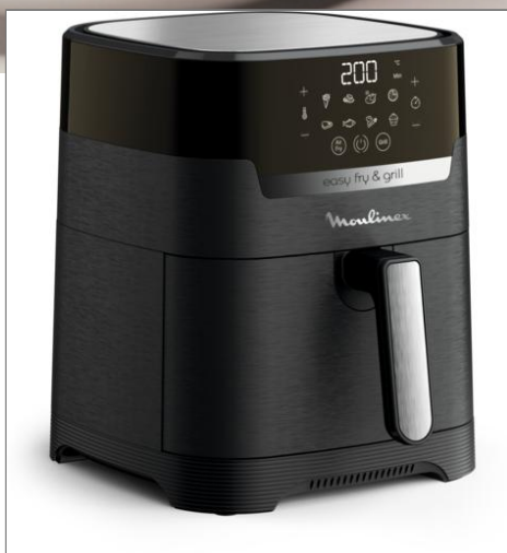
FRIGGITRICE AD ARIA EASY FRY & GRILL DIGITALE REA_40_000605: CREA EZ505810